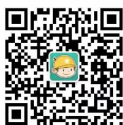
浙江电力公众微信

您可以关注公众微信“国网浙江电力”(sgcc-zj)、网上国网 APP、公众微信“12398 能源监管热线”、“12398 能源监管热线”APP。