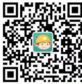
浙江电力公众微信

您可以关注公众微信“国网浙江电力”（sgcc-zj）、网上国网APP、公众微信“12398能源监管热线”、“12398能源监管热线”APP。