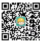
浙江电力公众微信

您可以关注公众微信“国网浙江电力”（sgcc-zj）、网上国网 APP、公众微信“12398 能源监管热线”、“12398 能源监管热线”APP。