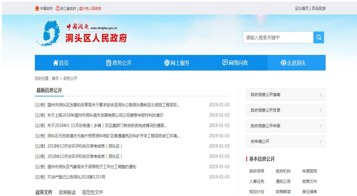
图 1 洞头政府政务公开门户网站

2. 洞头发布的政务微博、微信。推进政务微博、微信等新媒体政务信息发布平台建设，积极打造以“洞头发布”（如图 2 图 3）为龙头、集纳各街道（乡镇）、部门的“政务发布大厅”。