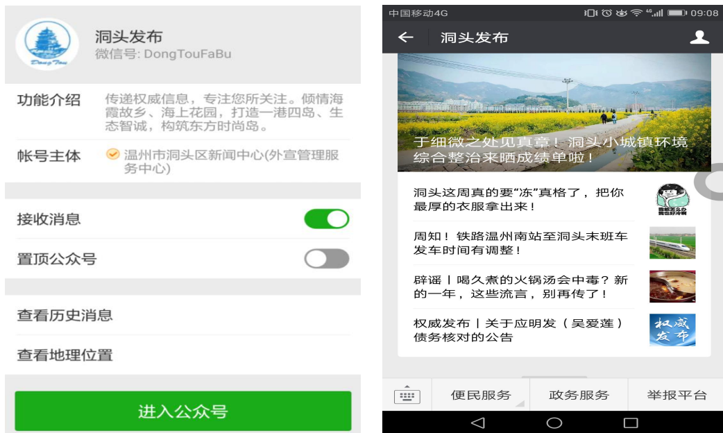
图 3 “洞头发布” 微信公众号

3. 新闻发布。通过新闻发布会、专题采访等多种形式，向社会发布信息以及开展各种政策解读。