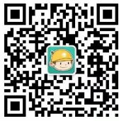
浙江电力公众微信

您可以关注公众微信“国网浙江电力”（sgcc-zj）、网上国网 APP、公众微信“12398 能源监管热线”、“12398 能源监管热线”APP。