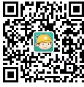
浙江电力公众微信

您可以关注公众微信“国网浙江电力”（sgcc-zj）、网上国网 APP、公众微信“12398 能源监管热线”、“12398 能源监管热线” APP。