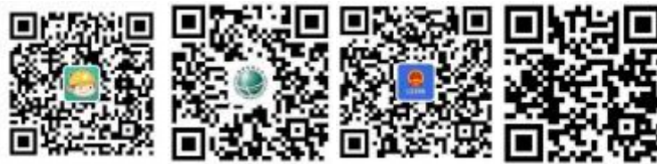
浙江电力公众微信

您可以关注公众微信“国网浙江电力”（sgcc-zj）、网上国网 APP、公众微信“12398 能源监管热线”、“12398 能源监管热线”APP。